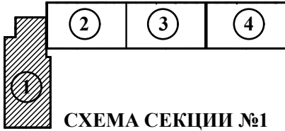
СХЕМА СЕКЦИИ №1 (1 этаж)