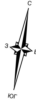
СХЕМА СЕКЦИИ №2 (1 этаж)